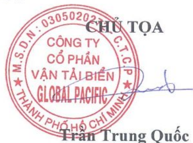
Trần Trung Quốc